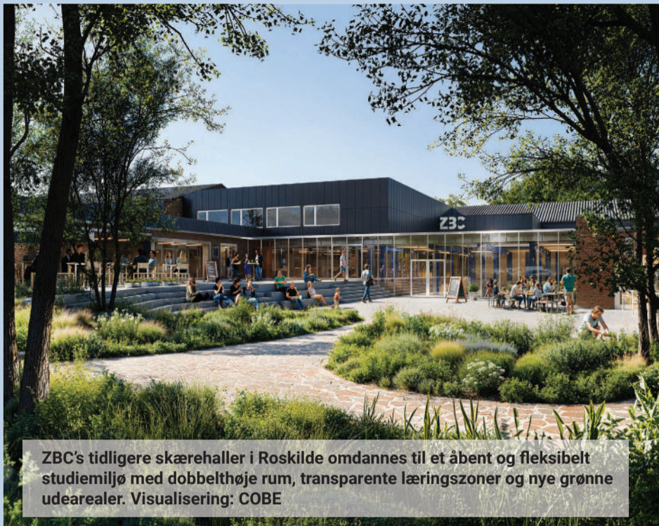
ZBC's tidligere skærehaller i Roskilde omdannes til et åbent og fleksibelt studiemiljø med dobbelthøje rum, transparente læringszoner og nye grønne udearealer. Visualisering: COBE