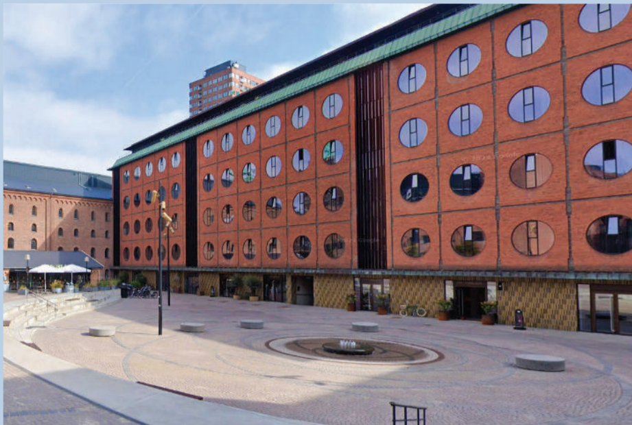
Udvidelsen af Hotel Ottilia har omdannet uudnyttede fredede industrirum til 14 nye værelser og suiter, hvor tekniske løsninger og arkitektur er integreret nænsomt i de historiske rammer. Visualisering: Arkitema