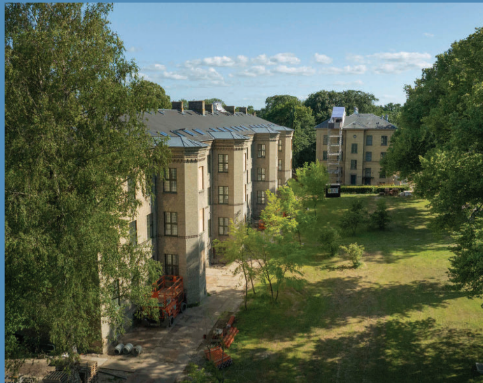
De to historiske hospitalsbygninger på Sankt Hans transformeres til 76 almene boliger, hvor originale materialer bevares og suppleres med moderne bæredygtige løsninger.