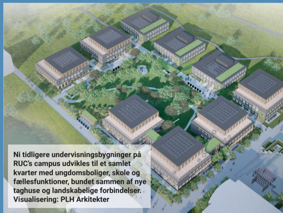
Ni tidligere undervisningsbygninger på RUC's campus udvikles til et samlet kvarter med ungdomsboliger, skole og fællesfunktioner, bundet sammen af nye taghuse og landskabelige forbindelser. Visualisering: PLH Arkitekter